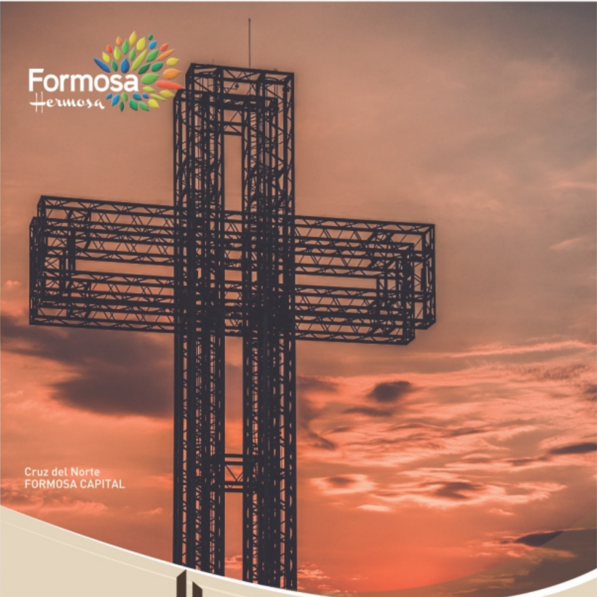
Cruz del Norte FORMOSA CAPITAL