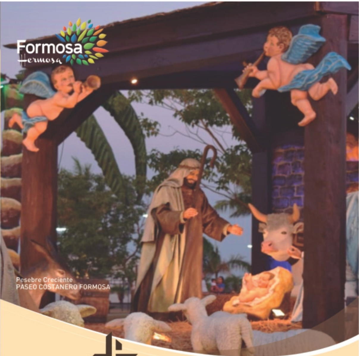
Pesebre Creciente PASEO COSTANERO FORMOSA

http://www.formosahermosa.gob.ar formosahermosaoficial@gmail.com Formosahermosaoficial Formosa Hermosa Ministerio de Turismo Formosa +54 3704 4425192 Via Crucis Formoseño Obispado: +54 3704 430814 Formosa Hermosa Argentina