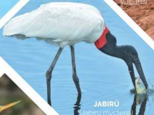
JABIRÚ ( Jabiru mycteria )