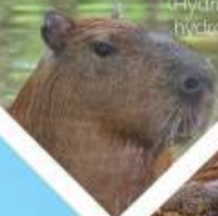
CARPINCHO ( Hydrochoerus hydrochaeris )