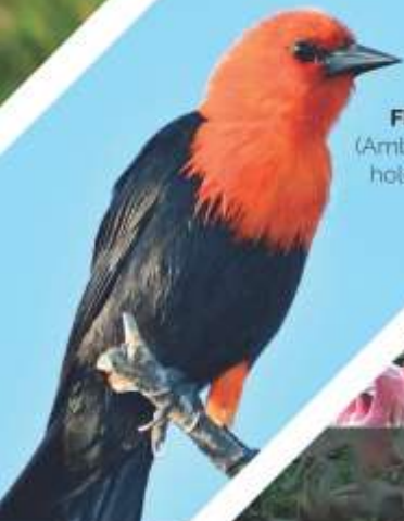
FEDERAL ( Amblyramphus holosericeus )