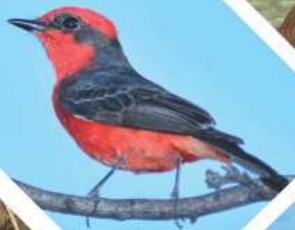
CHURRINCHE ( Pyrocephalus rubinus ) macho