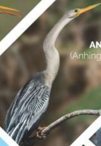
ANINGA ( Anhinga anhinga )