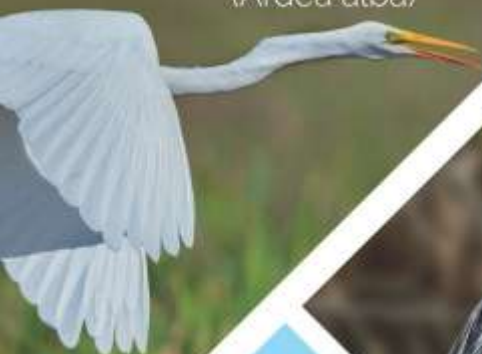
GARZA BLANCA ( Ardea alba )