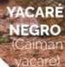
YACARÉ NEGRO (Caiman yacaré)