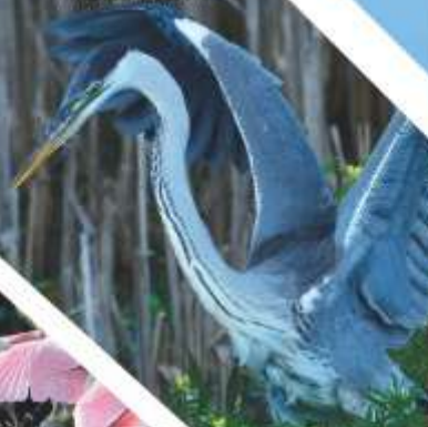
GARZA MORA ( Ardea coccyz )