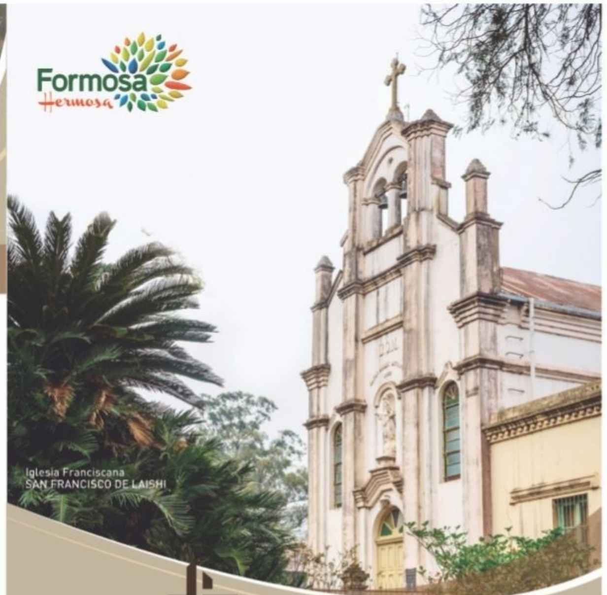
Iglesia Franciscana SAN FRANCISCO DE LAISHI